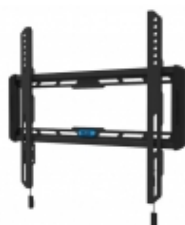
WL30-550BL14 - TruVision - Staffa parete per Monitor 32"- 66" fissa

Staffa a muro fissa nera ultrasottile per LCD 10-30"