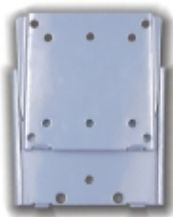
FPMA-W25 - TruVision - Staffa muro fissa nera per LCD 10-30"

Staffa a muro 3 snodi nera per LCD 32-60"