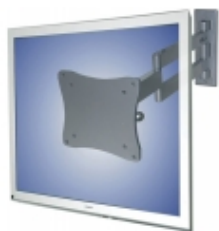
FPMA-W830 - TruVision - Staffa muro 3 snodi argen per LCD 10-24"