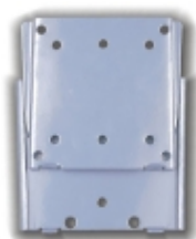
FPMA-W25 - TruVision - Staffa muro fissa nera per LCD 10-30"

Staffa a soffitto nera h.79-129cm per LCD 10-26"