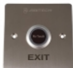
ACA-STEEL - Aritech - Pulsante richiesta uscita touch inox

Pulsante di richiesta uscita di colore bianco, dotato di simbolo di riconoscimento. Da utilizzare per un montaggio a superficie. Chiusura del contatto bistabile.