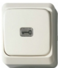
ACA001 - Aritech - Pulsante richiesta out interno var