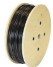
AD88N-0500 - Kidde Commercial - Aritech Fire - Cavo NY termosensibile 88° NoReset 500m €8.820,20

Cavo termosensibile digitale non resettabile, temperatura di intervento 88°C, omologato UL/ULc. Massima temperatura ambiente di installazione 69°C. Guaina esterna di protezione in Nylon, colore nera. Fornitura in matasse da 100 metri.