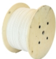
AD88-1000 - Kidde Commercial - Aritech Fire - Cavo PVC termosensibile 88° NoReset 1Km €14.994,20

Cavo termosensibile digitale non resettabile, temperatura di intervento 88°C, omologato UL/FM. Massima temperatura ambiente di installazione 69°C. Guaina esterna di protezione in PVC, colore bianca. Fornitura in matasse da 500 metri.