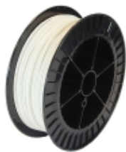
AD88-0100 - Kidde Commercial - Aritech Fire - Cavo PVC termosensibile 88° NoReset 100m €1.499,49

Cavo termosensibile digitale non resettabile, temperatura di intervento 88°C, omologato UL/FM. Massima temperatura ambiente di installazione 69°C. Guaina esterna di protezione in PVC, colore bianca. Fornitura in matasse da 100 metri.