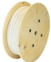
AD88-0500 - Kidde Commercial - Aritech Fire - Cavo PVC termosensibile 88° NoReset 500m €7.497,07

Cavo termosensibile digitale non resettabile, temperatura di intervento 88°C, omologato UL/FM. Massima temperatura ambiente di installazione 69°C. Guaina esterna di protezione in PVC, colore bianca. Fornitura in matasse da 100 metri.